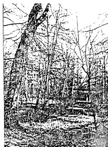
Boven links: tamme kastanjelaars langs het belangrijkste pad Onder links: het berkenbosje Rechts: moerasland met veel wilgebomen

Eind januari besliste de executieve en de Ukkelse gemeenteraad heeft op 26 januari de gratis afstand van grond goedgekeurd. De verkoop kan gebeuren!