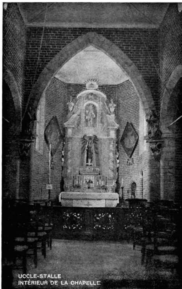
UCCLE-STALLE INTÉRIEUR DE LA CHAPELLE